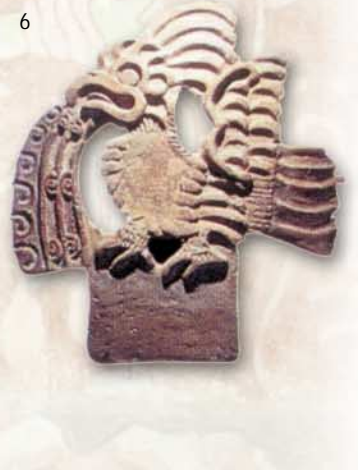
1 - Piramida Sonca (1) - Piramida Lune zaključuje glavno ulico (2) - Pogled iz palače Quetzalpapalotla (3) - Pogled s piramide Sonca na neodkopano mesto (4) - Strme in visoke stopnice (5) - Kamnita ptica, ki bruha vodo (6) - Bog dežja Tlaloc (7)

M ehiška kotlina leži na nadmorski višini 2000 metrov, obdajajo pa jo s snegom pokriti vulkanski vrhovi. Pred prihodom krutih španskih osvajalcev leta 1519 so na osrednjemehiškem višavju cvetele številne civilizacije. Najpomembnejša središča so: Tula (Tolteki), Tenochtitlan (Azteki) in Teotihuacan.