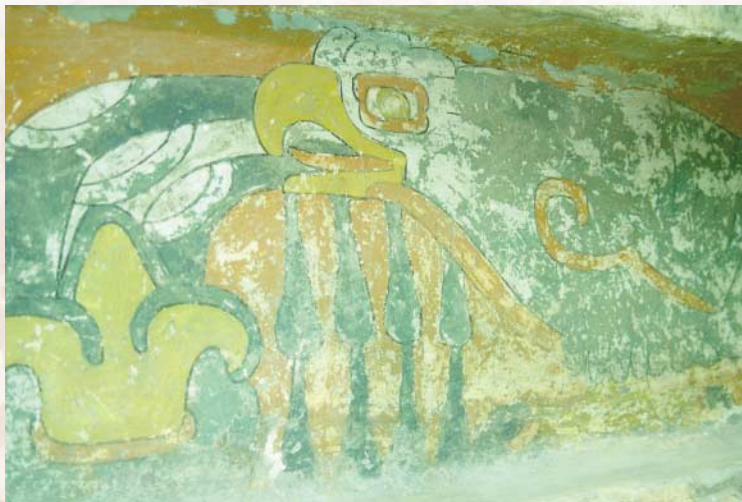
Freska papagaja - Quetzalcoatl - Cvetovi kaktusa - Prodajalec spominkov